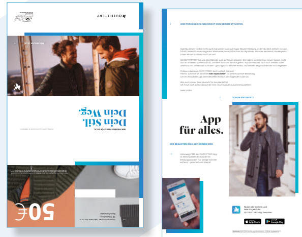
Komplexe Kampagne in wenigen Klicks angelegt

Die Conversion Rate der postalischen Mailings lag durchschnittlich über alle Segmente bei 4,5% und erreichte sogar bei den inaktiven Kunden eine Conversion Rate von 3%. Somit war die Contribution Margin 3 (nach Marketingausgaben) deutlich positiv.